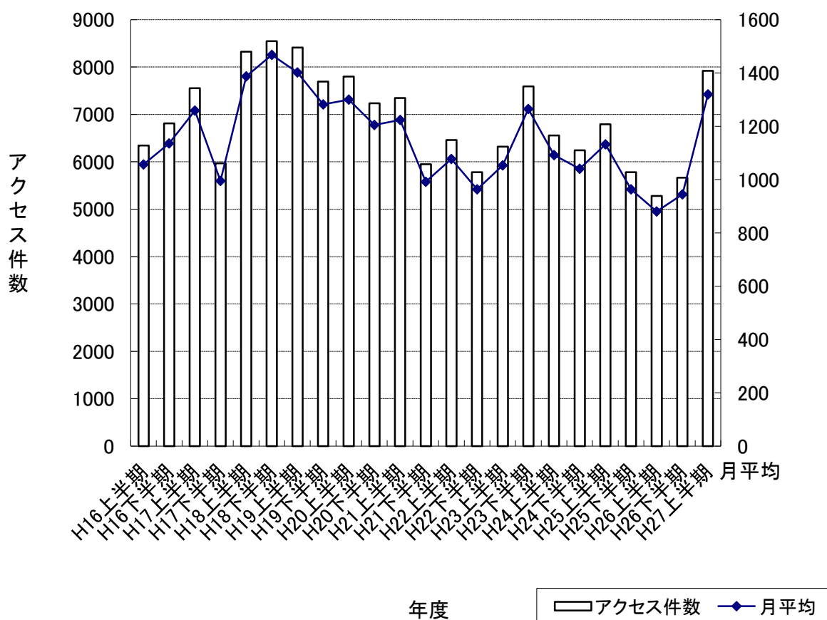
栗東歴史民俗博物館 ホームページアクセス件数