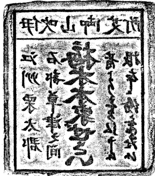
梅木本家ぜさい版木 拓本