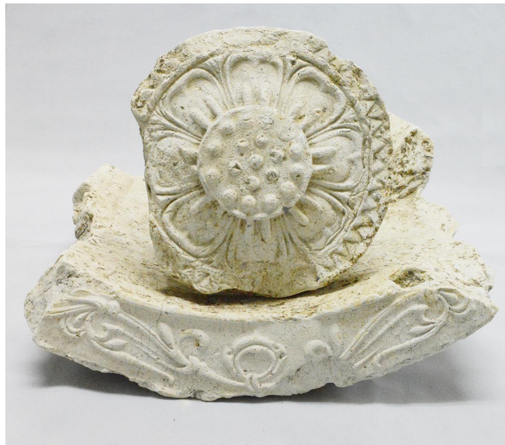
飛鳥時代の法隆寺式軒瓦

今回の報告会では、蜂屋遺跡の発掘調査で明らかとなった古代寺院に加え、その前の段階やその後の姿を、調査担当者が詳しく解説します。