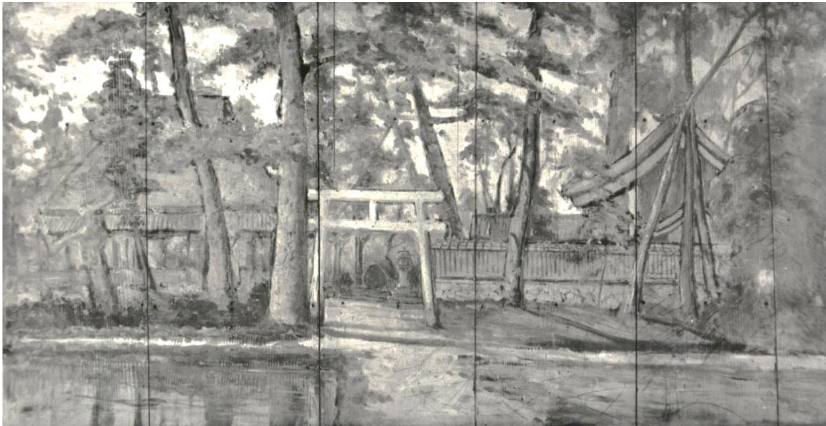
征露記念奉納額(国松桂溪画、出庭神社蔵)

令和4年度の「平和のいしずえ」展は、日露戦後から昭和10年代を中心に、人びとの平和へのまなざしと地域のくらしを、資料を通じて紹介します。市民のみならず、多くの方々に戦争と平和について考える機会となることを願い、この展覧会を開催します。