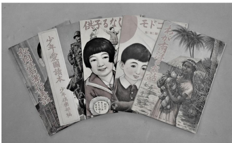
子供向けの小冊子(当館蔵)