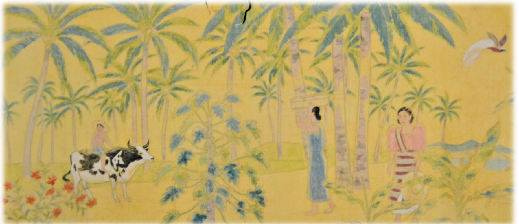
南国風景屏風下絵（西田恵泉画、個人蔵）