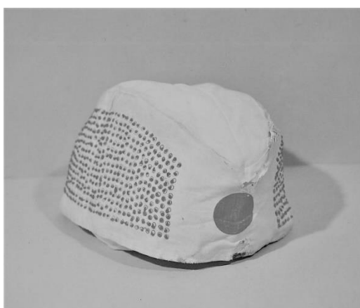
帽子型の千人針(当館蔵)