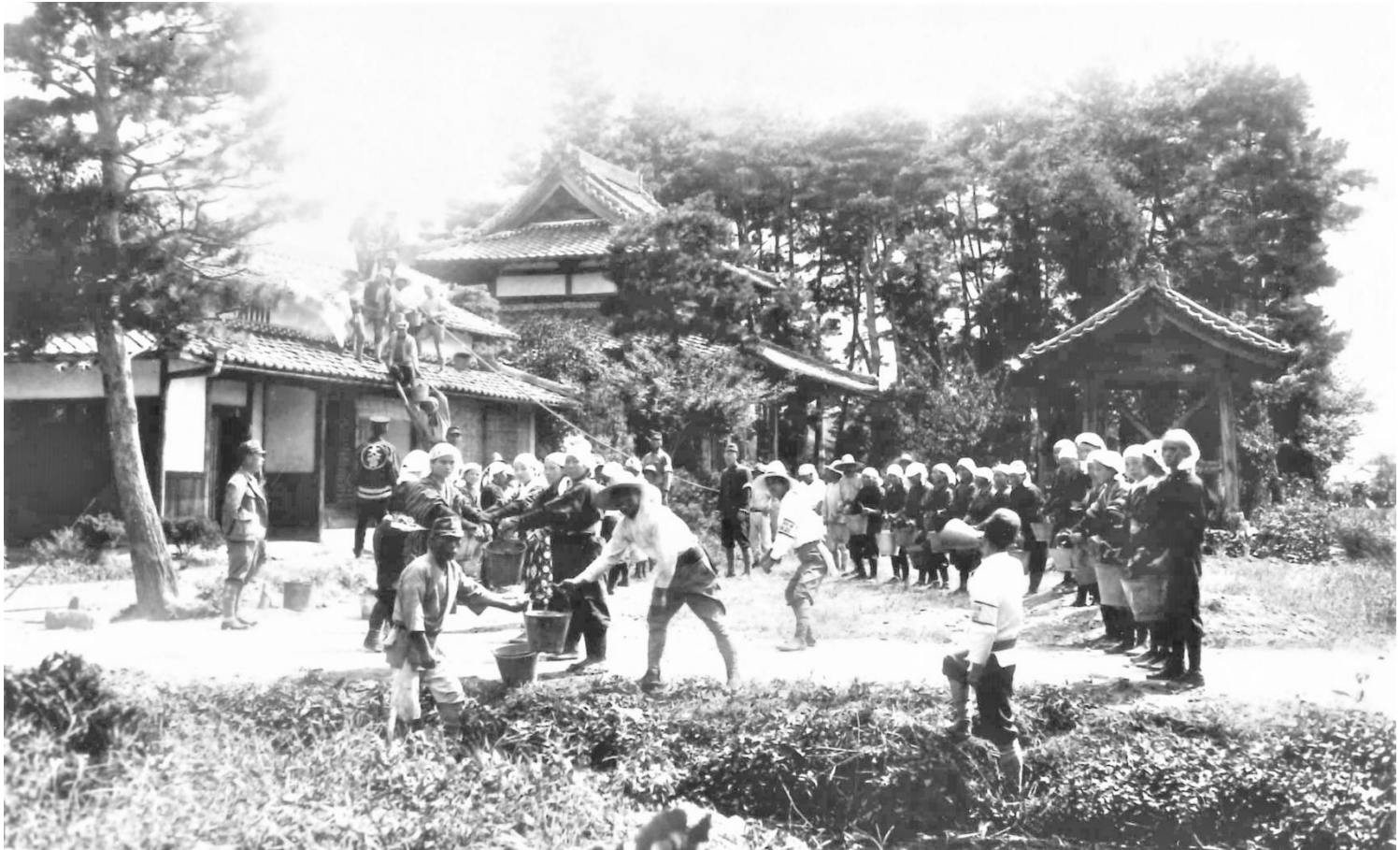
北中小路 運水(防火訓練)