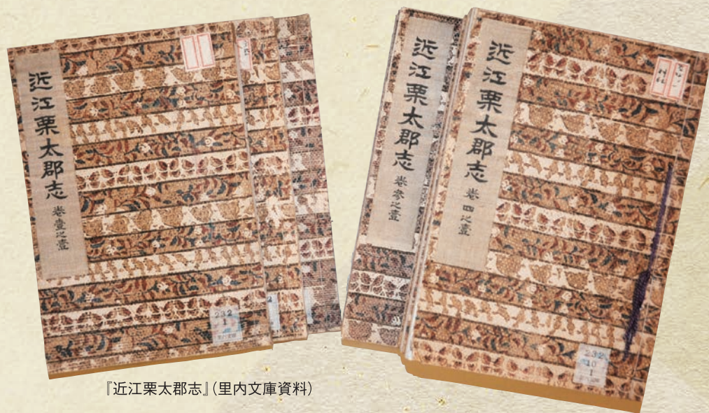
『近江栗太郡志』(里内文庫資料)