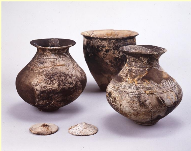
靈仙寺遺跡出土 弥生土器

栗東歴史民俗博物館では平成12年度から毎年度、市内のひとつの大字を取上げ、その歴史と文化を紹介する展覧会を開催してきました。今回は大宝地域から、靈仙寺地区を取り上げます。