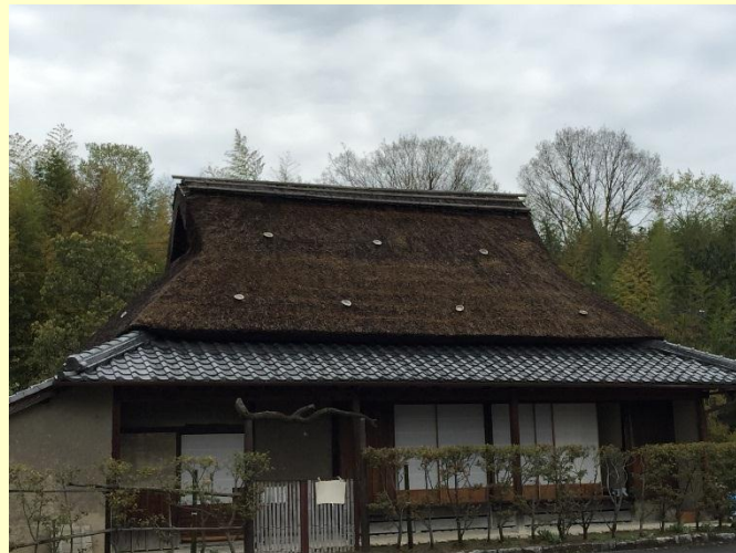
移築民家 旧中島家住宅(国の登録有形文化財) ※靈仙寺から栗東歴史民俗博物館に移築したものです