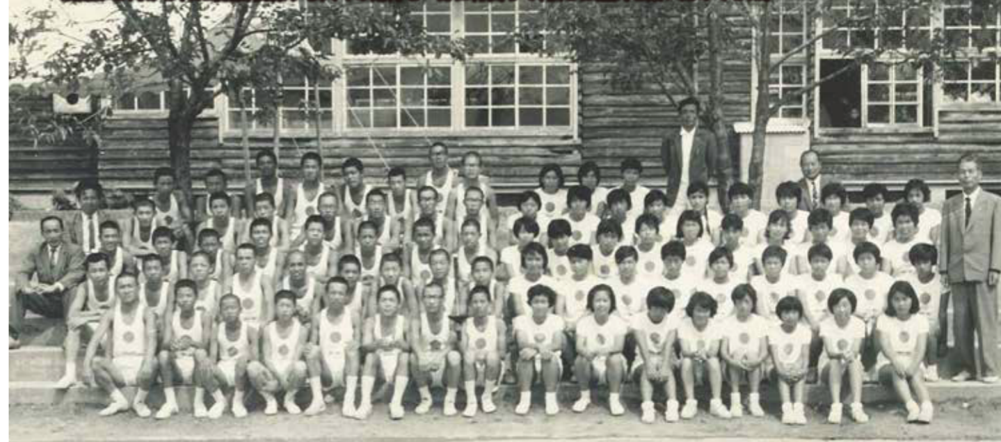
栗東中学校から選ばれた男子40名、女子40名の滋賀県内第17区から第20区(栗東区間)の随走者

栗東に設定された4つのリレー区間、この区間では計92人の聖火ランナーたちが走りました。1つの区間を走る聖火リ レー隊は、聖火を掲げて走る正走者1名、その後ろに予備のトーチを持つ副走者2名、その後ろに20名の随走者の合計23 名で構成されていました。正走者は県下から運動に秀でた高校生を中心とした若者が、副走者はリレー区間の近隣から同 じく運動に秀でた高校生が、随走者は地元、栗東中学校から選ばれた生徒たちが担いました。 沿道から向けられた視線、関係する人々の期待を一身に背負って、彼らは聖火を繋いだのでした。