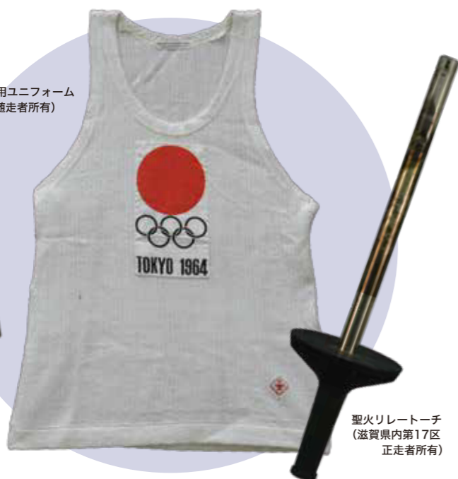
聖火リレー走者男子用ユニフォーム (滋賀県内第17区 随走者所有)