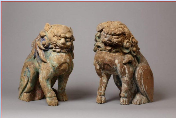
(上)五百井神社 木造獅子・狛犬