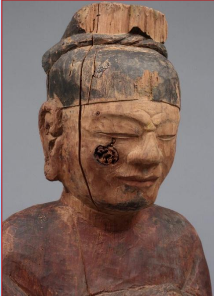
(左)五百井神社 木造男神坐像 (滋賀県指定有形文化財)