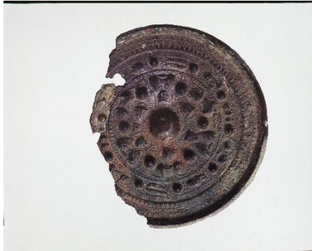
三角縁神獸鏡(亀塚古墳出土)