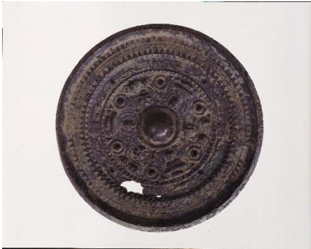
三角縁神獸鏡(岡山古墳出土)

なお、平成27年12月に滋賀県指定有形文化財として指定された、五百井神社（栗東市下戸山）の木造男神坐像も展示します。