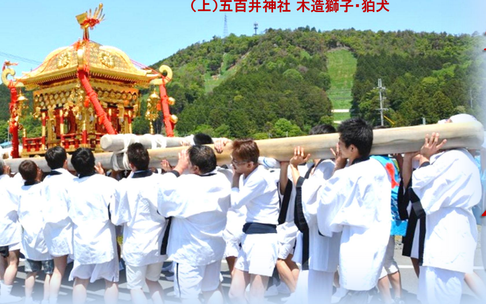
五百井神社例大祭みこしの巡行(平成27年5月5日)