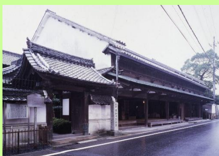
旧和中散本舗 大角家住宅 （重要文化財）