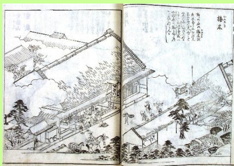
『東海道名所図会』より「梅木」

江戸時代の栗東には、東海道と中山道の2つの街道が通り、宿場と宿場の間の休憩所・立場（たてば）が3か所に置かれていました。様々な資料から、立場のにぎわいをご紹介します。