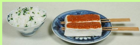
目川田楽と菜飯（復元）