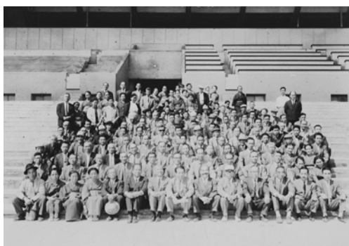
栗東トレーニング・センター用地の地権者たち 京都競馬場にて撮影、個人蔵

トレーニング・センターが栗東に立地した理由として、昭和38年（1963）に開通していた名神高速道路により、京都・阪神・中京の各競馬場まで、迅速かつ安全に競走馬を輸送できることが挙げられます。また、トレーニング・センターの設置は、高速道路建設の目的の1つである丘陵地域の開発が実った代表例といえることができます。