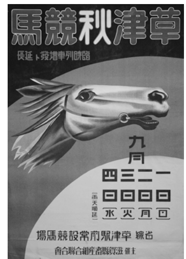
草津競馬ポスター 昭和10年（1935） 栗東歴史民俗博物館 所蔵