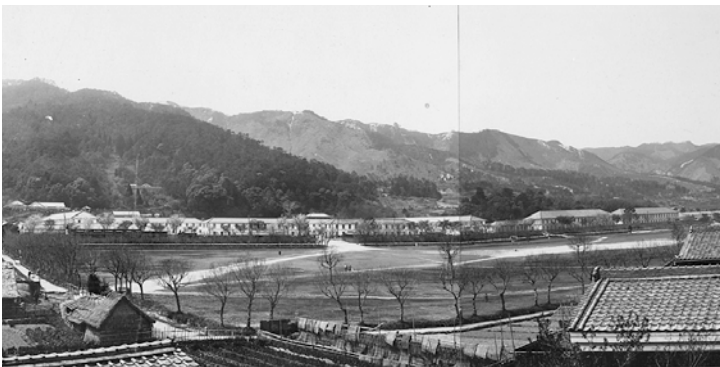
第九連隊兵舎全景 明治時代末期

大正12年（1923）4月、馬券の発売を正式に認める競馬法（旧競馬法）が制定され、昭和2年（1927）8月に農林省令で地方競馬規則が発せられたのをきっかけに、各地で地方競馬の開催が計画されるようになります。滋賀県では、畜産組合連合会が大津練兵場を借用し、春秋に地方競馬を開催しました。