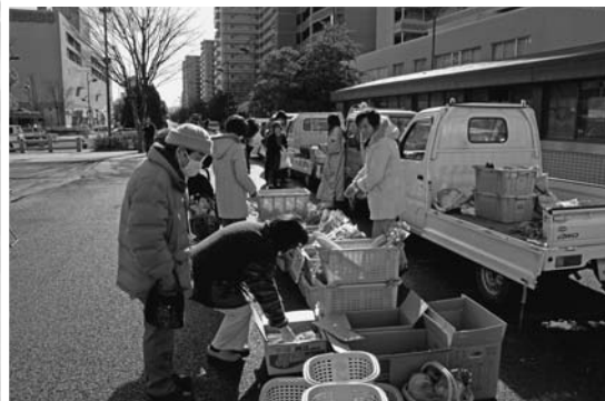
▲栗東産の新鮮な野菜などを販売