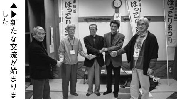
▲▶ した 新 た な 交 流 が 始 ま り ま す