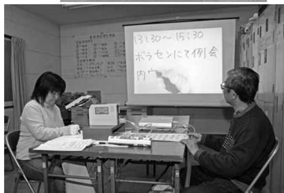
▲OHCという機器を使ってスクリーンに文字を映します

対して、聞こえてくる話の内容をその場で要約し、文字にして伝える筆記通訳のことです。利用者の隣で紙に書くノートタイプと、OHCという機器を使いスクリーンに映す方法があり、最近ではパソコン要約筆記などもあります。現在のメンバーは8人です。毎月第2、第4水曜日の13時30分～15時30分にボランティア・市民活動支援センターで例会を開いています。例会では、各自の活動に対する思いや、普段の生活などについて話をして、それを要約筆記する練習方法を行っています。外での活動としては、メンバーそれぞれが滋賀県立聴覚障害者センターに要約筆記者として登録しており、センターからの依頼に応じて活動しています。会議、講演会、