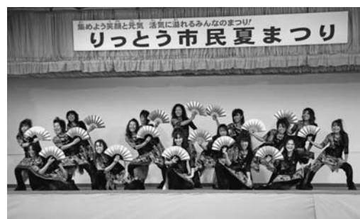
▲趣向を凝らしたステージ演舞(昨年)