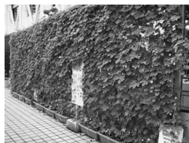
▲栗東市役所前のみどりのカーテン（昨年）

世帯と公共施設にゴーヤの苗を配布しました。昨年からの好評で取り組みが広がってきています。