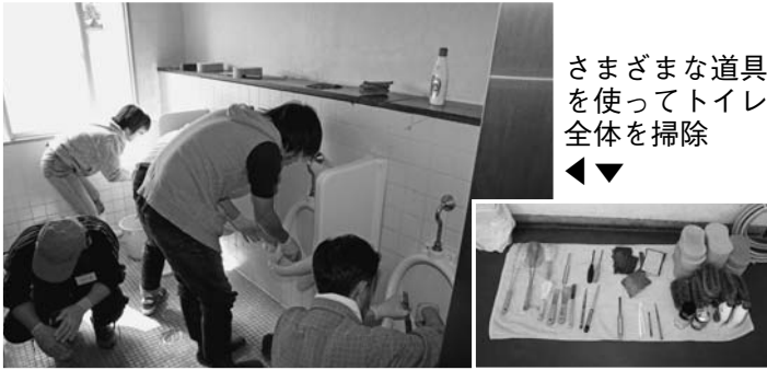
さまざまな道具 を使ってトイレ 全体を掃除