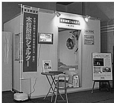
▲耐震シェルターの例