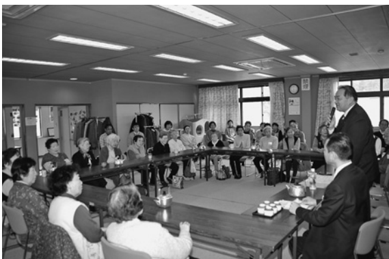
◀市長のこんにちはトーク

■トークのお相手…市内で自主的な活動を行っているグループ・団体で、10人～20人程度。ただし、政治、宗教または営利を目的としたグループ・団体は除きます。