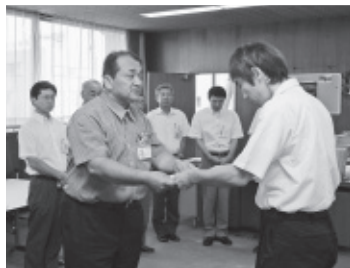
▲派遣する職員に辞令を交付

さて本年10月1日に、栗東町が栗東市となって10年を迎えます。10月2日には、市民の皆さまと今日までの市の発展を祝うとともに、さらなる飛躍を願い、「栗東市制施行10周年記念式典」を開催します。多くの皆さまのご来場をお待ちしています。