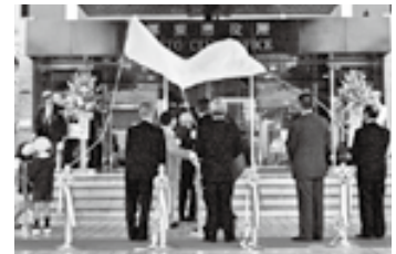
▲栗東市制施行(平成13年)