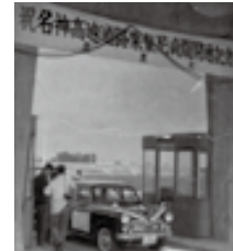
▲名神高速道路開通(昭和38年)