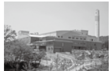
▲新環境センターが稼働(平成14年)