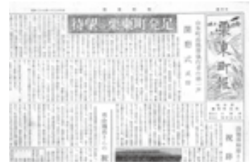
▲栗東町報創刊号(昭和29年)