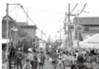
▲にぎわいを見せる昨年のほっこりまつり

今年は、早くから実行委員会を立ち上げ、子どもからお年寄りまで多くの人々が楽しめる企画が検討されています。地域住民の皆さんが「東海道」を貴重な財産として見つめ直し、地域のまちづくりや景観ま