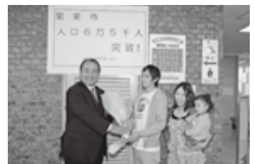
▲人口6万5千人突破(平成23年)