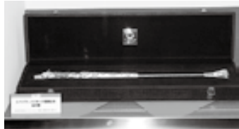
▲展示予定の「金の鞭」

栗東トレーニング・センター角居厩舎で管理されているヴィクトワールピサ号が今春、世界最高峰のレース「ドバイワールドカップ」で優勝した際に記念に贈られた「金の鞭」など、栗東トレーニング・センターで調教された歴代の名馬たちの調教ゼッケンのほか、関係グッズの展示会を開催します。