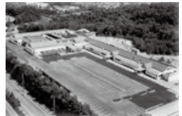
▲なごやかセンター開館(平成16年)