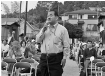
▲観音寺での景観まちづくりシンポジウムにて

秋は市内各所で、敬老会、運動会、祭りなどさまざまな行事が開催されています。これら多くの行事が地域住民の皆さまが主体になって企画・運営され、子どもから大人まで幅広い世代が触れ合いを深めておられます。にぎわいの中であふれる笑顔に、「市民力」「地域力」の大きさを強く感じるとともに、まさに元気都市栗東の源がここにあることを実感しました。