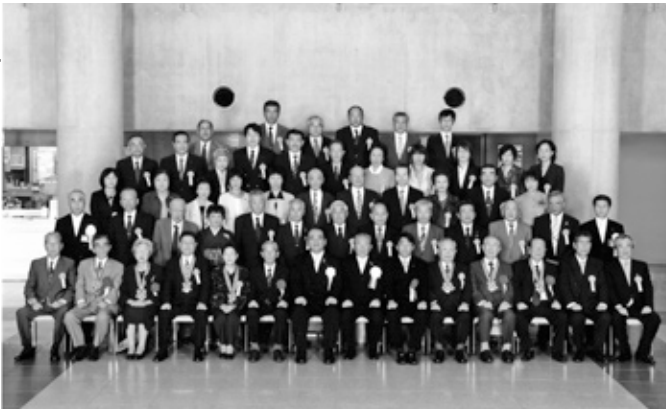
▲表彰を受けた皆さん