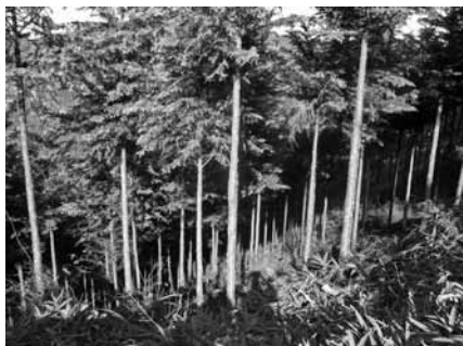
▲栗東の豊かな森林

この協定に基づき、商工会が会員企業から小口協賛を取りまとめ、“栗東きょうどう夢の森”と名付けた金勝地域の森林づくりや森林再生のために、平成21年度から平成25年度までの5年間で450万円の整備資金を金勝生産森林組合に提供される予定です。その資金をもとに、同組合が所有する森林の間伐や枝打ちなどの山の手入れを行うことによって、二酸化炭素の吸収量を増やしていこうというものです。