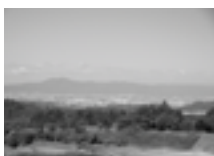
▲観音寺からの美しい眺め

こうした協働による景観まちづくりを進めていく中で、観音寺に住んでみたい、観音寺のまちづくりに関わってみたいと思っている人にも、気軽に住民の皆さんと交流し、まちづくりに取り組んでもらえるような仕組みとして、「観音寺天水クラブ」が生まれました。