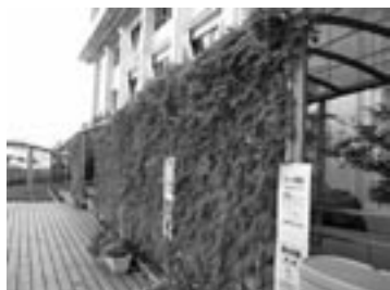
市役所前で実施したみどりのカーテン（昨年）▶

5月から種や苗を育て始めると、暑さが厳しくなる8月ごろには葉も大きくなり、立派なカーテンが出来上がります。