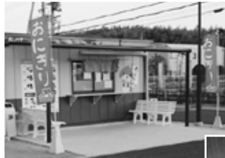
▲おにぎりのドライブスルー ▼店内に並ぶ栗東産野菜や果物

栗東で採れた農産物を食べていただき、地産地消を促進することで、農業者や農地、また私たちの食と健康についてあらためて考えていただけたらと思います。