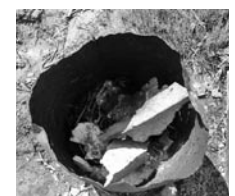
◀ドラム缶を用いた焼却跡