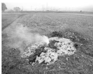
▲剪定した木の焼却

屋外でごみを焼却する「野焼き」は、廃棄物の処理及び清掃に関する法律で禁止されています。「窓を開けていると煙や臭いが入ってきて困る」、「煙を吸ってせきが止まらない」など、毎年多くの苦情が市へ寄せられています。(平成23年度は46件対応)