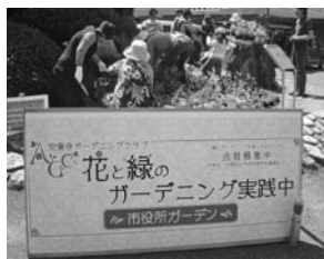
▲市役所ガーデン活動

市役所庁舎前ロータリーの花壇に四季を感じる花々を植え、住民と職員の協働作業としてコミュニティガーデンを作りました。今後は、安養寺東のたご公園にて、コミュニティガーデンづくりを目指して、ワークショップ形式で計画づくりにあたっています。