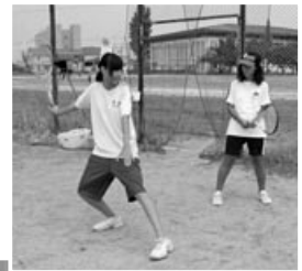
中学生の先輩が丁 寧に教えます

葉山中学校では、一足先に中学校の授 業や部活動を体験してもらおうと、「オ ープンスクール」を実施。来年入学予 定の葉山・葉山東小学校の6年生約40 人が参加しました。模擬授業 では、理科、英語、家庭、技 術から、興味のある科目を選 んで体験。部活動体験では、 各部の先輩から丁寧な指導を 受け、もうすぐやってくる中 学校生活への期待を膨らませ ました。