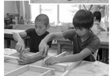
技術の模擬授業で 木工に挑戦