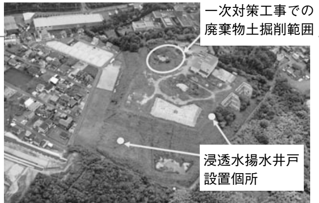
一次対策工事での 廃棄物土掘削範囲