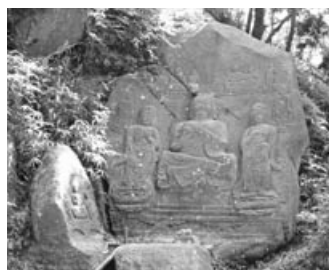
静寂の中の狛坂磨崖仏▶