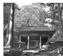
紅葉に包まれた秋の金勝寺▲