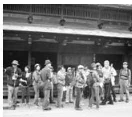
旧和中散本舗も訪れます▲