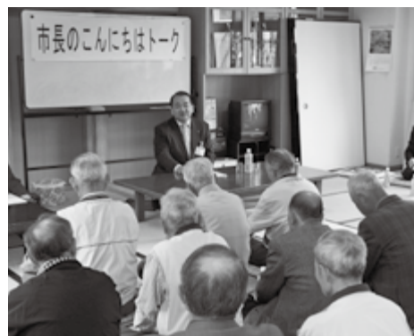
▲市長のこんにちはトーク

※市内の幅広いグループ・団体との対話を優先しますので、同一グループとの定期的な対話はしません。また、要望、陳情の場ではありません。