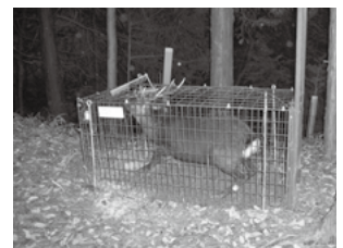
▲被害を防ぐため増えすぎたシカを捕獲