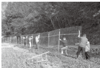
▲集落のみんなで防護柵を設置

各被害集落ではシカやイノシシから水稲や野菜を守るため、集落の農地をまとめて囲う大規模な防護柵の設置を進めています。防護柵は農業組合や自治会が中心となり、自力施工で設置を行います。大規模な柵は設置に手間や人手がかかりますが、各圃場を個々に