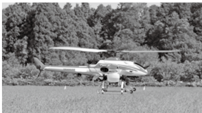
無人ヘリコプターによる防除

水稲の病気や害虫の発生を防止するため、7月末から8月上旬にかけて、稲の広域一斉防除が実施されています。これは、必要最低限の農薬の散布により、環境にやさしい安全・安心な農業の確立を目指し、より安全な良質米の安定生産に努めるために実施されるものです。詳しくは、JA