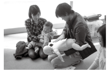
▲救命救急セミナー

市では“男女共同参画セミナー”や“きらめきRitto”事業として、昨年度は親子料理教室や防災・救急救命セミナー、男性の介護セミナーを実施し、男女共同参画社会づくりの推進を図ってきました。本年度も上記事業を通じて、男女が協力し合い、支え合いながら発展する社会を目指していきます。