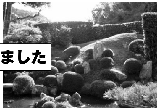
◀ 国名勝の旧和中散本舗庭園