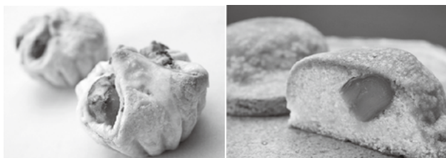
▲栗を使ったお菓子「へそくりパイ」(左)と「へそくりmanju」(右)

マップは栗東駅・手原駅や掲載店舗などに配置する予定です。詳細は栗東市商工会ホームページ ( http://www.rittosci.com/ ) をご覧ください。