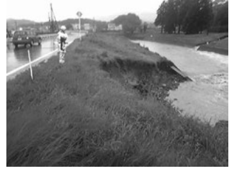
▲上砥山地先金勝川堤防

市では、直ちに災害対策本部を立ち上げ、被災状況の把握に努め、被災個所の緊急対応にあたっています。引き続き、1日も早い復旧・復興を目指して取り組みを進めるとともに、被災された方の支援に全力で取り組んでまいります。