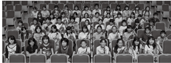
定期演奏会に向けて練習に励んでいます▼▶

一番大きな発表の舞台が、毎年秋に行っている定期演奏会。そのほか、びわ湖ホールで行われる「びわ湖・アート・フェスティバル」や「ラ・フォル・