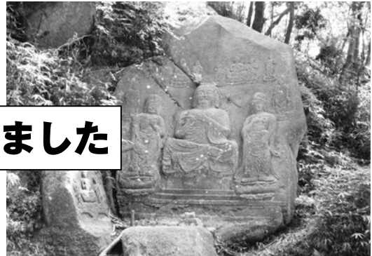
◀ 静寂の中の狛坂磨崖仏