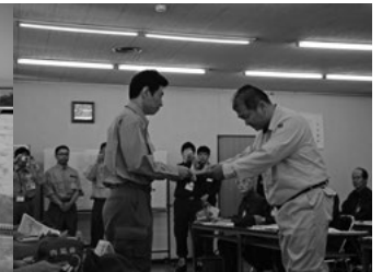
▲復旧に向けて取り組んでいます▲