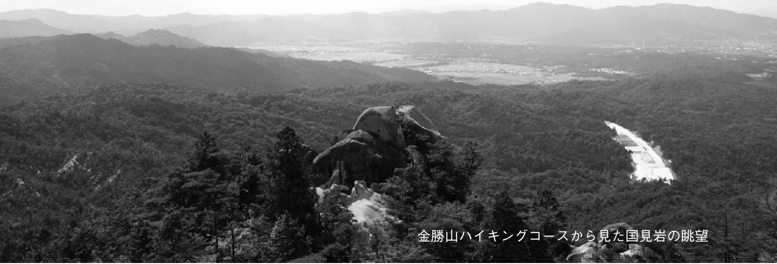
金勝山ハイキングコースから見た国見岩の眺望

「金勝山ハイキング」と「いにしえをしのぶ近江東海道ウォーク」には、専門家やガイドによる案内が揃っています。各イベントの詳細は、栗東市観光物産協会ホームページ ( http://www.ritto-kanko.com/ ) または駅や各コミュニティセンターに設置のチラシをご覧ください。天候などによって内容が変更になる場合があります。