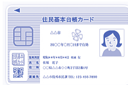
▲住民基本台帳カード(見本)