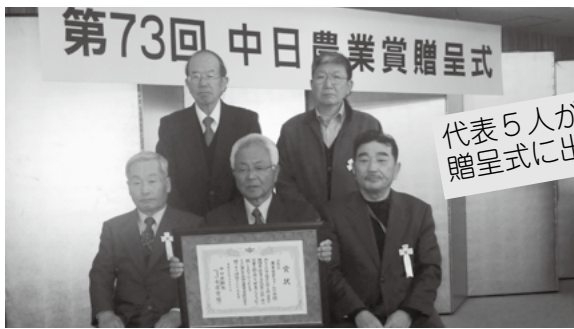
代表5人が贈呈式に出席

■「栗東食育ファームの会」が中日農業賞特別賞を受賞 学校給食への野菜供給で自立した組織による取り組みと、市内小学校への食育授業への参加など、定年後の地域貢献活動が認められ、栗東食育ファームの会が中日農業賞特別賞に選定されました。