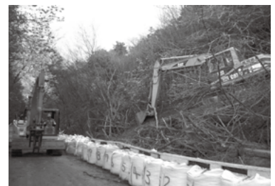
◀安養寺山北側工事