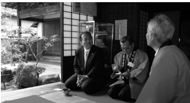
▲旧和中散本舗の開場にあわせて設けられたお茶席で、地域の皆さまの声を聞かせていただきました