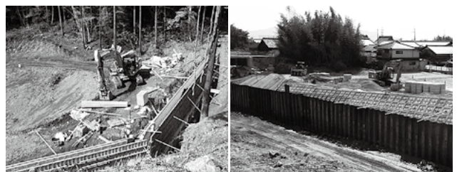
▲安養寺山治山工事(左)と金勝川災害復旧工事

問合せ…危機管理課 総合防災・危機管理係 ☎551-0109 ☎551-0149