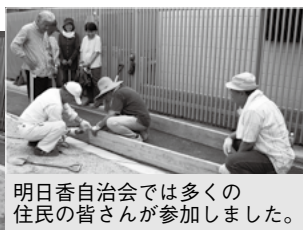
明日香自治会では多くの住民の皆さんが参加しました。

「地域振興協議会コース」の採択を受け、防災かまどベンチ設置に取り組む大宝西学区地域振興協議会。大宝西学区で初めての設置となった、