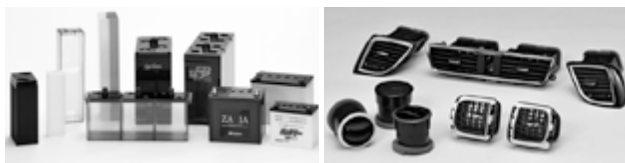
▲バッテリーケース（左）と自動車内装部品

当事業部の主な製品はバッテリーケース、自動車部品などで、弊社のノウハウを駆使した射出成形技術と金型技術などでお客様からのあらゆるニーズにお応えしています。