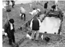
ビオトープの管理を行う下戸山農村環境保全活動の皆さん

市内では、農村まるごと保全向上対策を進める地域が12地域あり、それぞれが活動組織を設立し、農地、農業用水路、農道などの維持管理、補修に努めています。平成27年からは、農業