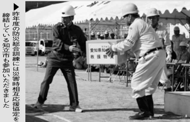
▶昨年度の防災総合訓練には災害時相互応援協定を締結している知立市も参加いただきました