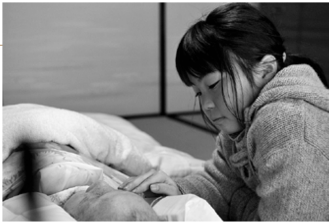
写真家 フォトジャーナリスト 國森康弘 写真絵本「いのちつぐ『みとりびと』」(農文協、現8巻) 第1巻「恋ちゃんはじめての看取り」より ※文中も同じ