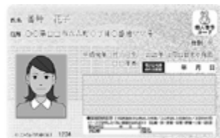
個人番号カード(表面)

通知カードとともに送付される個人番号カード交付申請書により申請すると、平成28年1月から希望者には無料で個人番号カードの交付を受けることができます。