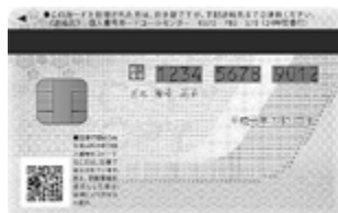
個人番号カード(裏面)

個人番号カードは、プラスチック製のICチップ付きカードで、券面に氏名、住所、生年月日、性別、マイナンバー(個人番号)と本人の顔写真等が表示されます。