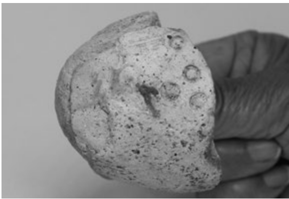
◀手原遺跡から出土した土馬

今回は、本年6月に市内大橋7丁目で行われた手原遺跡の発掘調査で発見された、奈良時代の土馬を紹介します。