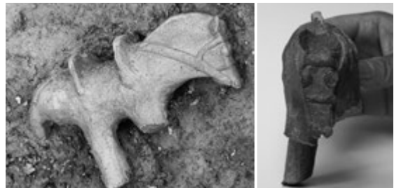
◀博物館にも出品される土馬(下鉤東・蜂屋遺跡)

市内出土の土馬9点が揃って出品され、12月13日(日)には研究報告会も行われます。研究報告会では、詳しい解説があります。この機会に、いにしへの栗東に思いを馳せてみませんか。