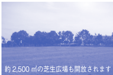
約2,500㎡の芝生広場も開放されます

汚泥再生のしくみをわかりやすく紹介するほか「処理水をよりきれいにする」ミニ実験コーナーもあります。どなたでも自由に参加体験できます。