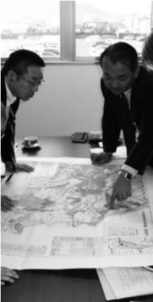
トップセールスで情報交換