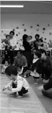
子育て支援センターの講座