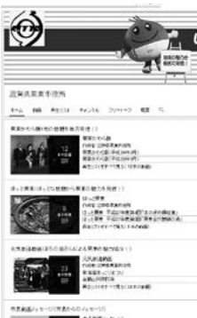
りっとうチャンネルで市をPR