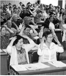
いきいき百歳体操で交流