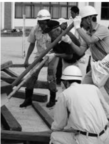
防災総合訓練を実施