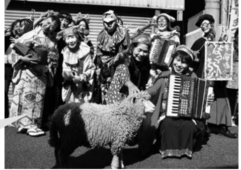
東海道ほっこりまつり