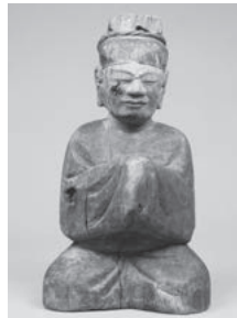
五百井神社(下戸山) 木造男神坐像