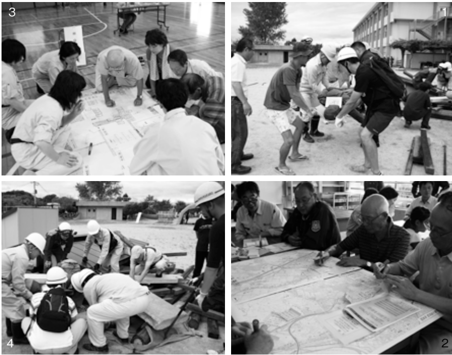
①④倒壊家屋からの救出救助訓練②水害図上訓練③広域避難所運営訓練などにより、土砂災害・地震災害への対応を訓練しました

8月27日、葉山東小学校 一帯で「栗東市防災総合訓 練」が行われました。 震度6強の地震が発生し たとの想定のもと、市民の 皆さんと防災機関が連携し ながら訓練を展開。 土砂災害防止活動（水防 工法）、避難所運営訓練（H UG）、水害図上訓練（R-I DIG）、応急炊飯訓練な ど、市民参加による学習体 験型の訓練が多く盛り込ま れ、市全体の防災力の向 上につながる一日となり ました。