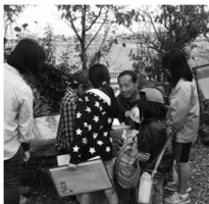
地域の魅力を知る「こころのたいけんクラブ」

大宝西学区の0〜1歳児を対象にした子育て支援事業「ほかほかひろば」では十里地域と近隣地域の交流に取り組んでいます。親子