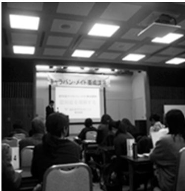
認知症キャラバン・メイト養成講座