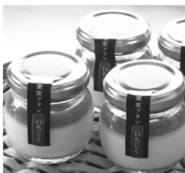
栗東いちじくとココナッツオイルを組み合わせて、半年かけて開発されたプリン。

例えば、県の「環境こだわり農産物」認証も受けている安全・安心な栗東いちじくは、ハウス栽培されていることから、皮ごと食べることができます。そのような情報を小さい店舗だからこそ、直接、味わう皆さんに伝えることができます。今後も積極的に地元にあるよい食材を皆さんに届けながら、情報発信していきたいです。