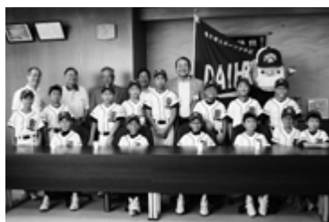
大宝少年野球スポーツ少年団 「第22回高野山旗全国学童軟式野球大会」2回戦突破

この夏、多くの小学生が全国大会に出場。全国を舞台に、それぞれのベストを尽くし、日頃の練習の成果を発揮しました。