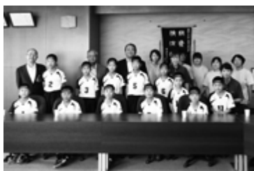
大宝バレースポーツ少年団 「ファミリーマートカップ 第37回全日本バレーボール小学生大会」3年連続出場