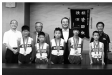
栗東陸上教室の皆さん 「日清食品カップ 第33回全国小学生陸上競技交流大会」チームで自己ベスト