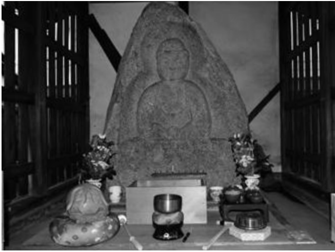
坊袋で親しまれている「大日さん」