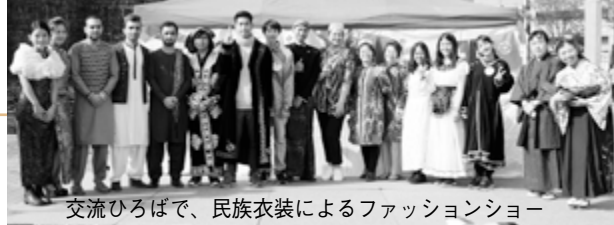
交流ひろばで、民族衣装によるファッションショー

本市には1106人（平成29年12月末現在）の外国籍住民が生活し、人口の1.6%を占めています。