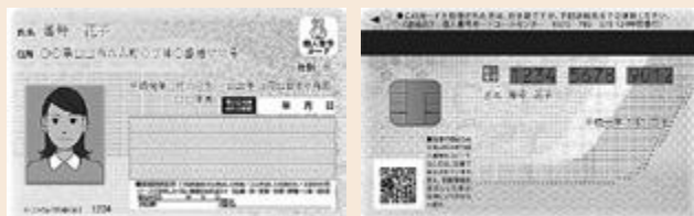
マイナンバーカード（表面） マイナンバーカード（裏面）

総合窓口課横に設置している証明書自動交付機は、平成30年3月31日で終了します。今後は休日や夜間（6時30分～23時）もマイナンバーカードを利用してコンビニエンスストアで証明書の交付が可能です。ぜひこの機会にマイナンバーカードを作成ください。詳細は、お知らせ版1ページをご覧ください。