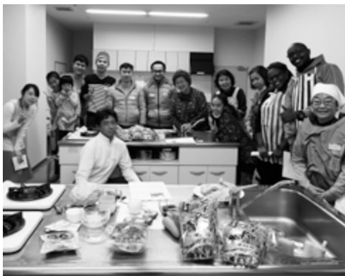
手軽に作れる和食づくりで異文化交流

手軽に作れる和食づくりをとおり、日本文化を体験し、参加者同士の交流にもつながりました。