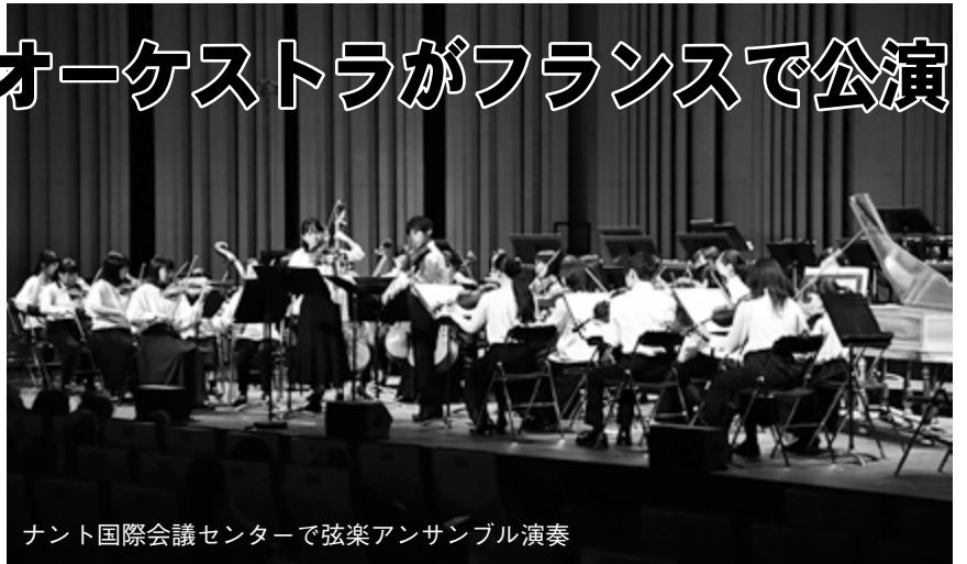
ナント国際会議センターで弦楽アンサンブル演奏

栗東芸術文化会館さきらを拠点に活動する「さきらジュニアオーケストラ」の有志が昨年10月にフランスで公演しました。これは、障がい者の文化芸術国際交流事業「2017 ジャパン×ナントプロジェクト」に特別枠で招聘を受け、実現。演奏は計2回で、10月19日、