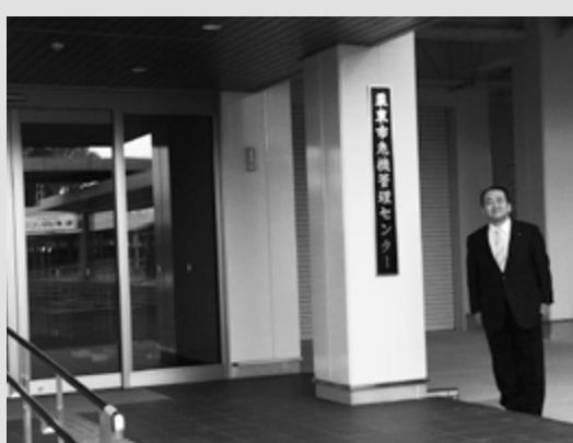
4月から栗東市危機管理センターの運用を開始します

平成30年度も、「いつまでも住み続けたいくなる安心な元気都市栗東」の実現に向け、果敢に挑戦しながらまちづくりに取り組んでまいりますので、皆さまのいっそうのご理解とご協力をお願いいたします。