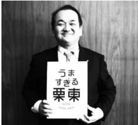
栗東市長 野村 昌弘

「市民の誇り、愛着心の向上」「まちの魅力の向上」「都市イメージの向上・情報発信」を目標に、平成27年、「栗東市シティセールス戦略」を策定し、まちを売り込む事業を展開中。