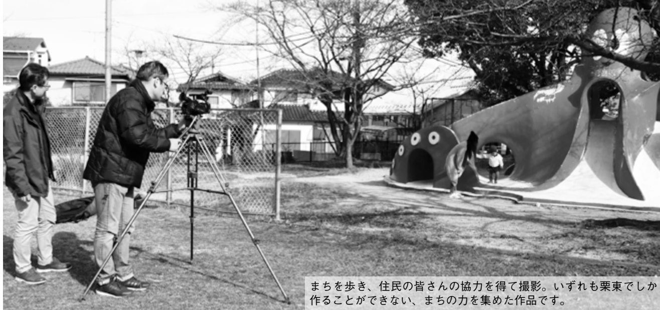
まちを歩き、住民の皆さんの協力を得て撮影。いずれも栗東でしか作ることができない、まちの力を集めた作品です。