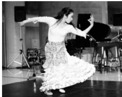
さきらアトリウムコンサートでの熱いステージ。ピアノとは初めての共演。14ページもあわせてご覧ください。