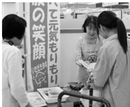
健康推進員が野菜摂取の必要性などを啓発市民の健康づくりを推進しています

実施した健康推進員は「スーパーの店舗前には、さまざまな年代、性別の地域住民が来られ、普段出会ったことが少ない若いお母さんや子ども、男性にも啓発することができました」と話されています。