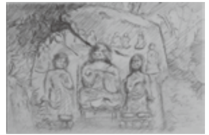
【狛坂磨崖仏】 栗東高等学校美術科ビジュアルデザイン専攻生作

〒520-3088 滋賀県栗東市安養寺一丁目13番33号 http://www.city.ritto.lg.jp/