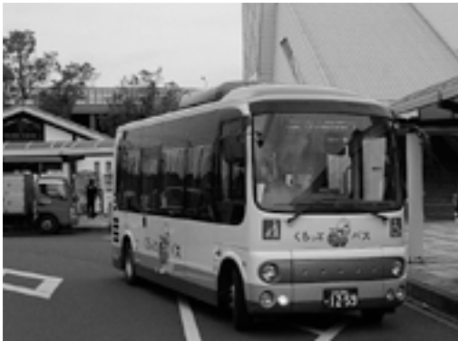
大宝循環線 新バス車両