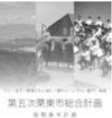
新しい総合計画に着手