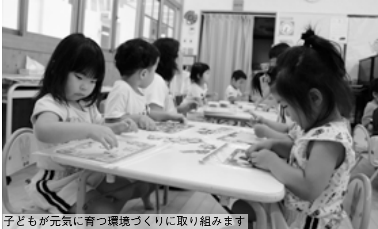
子どもが元気に育つ環境づくりに取り組みます