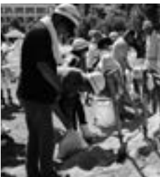
市の防災力を高める