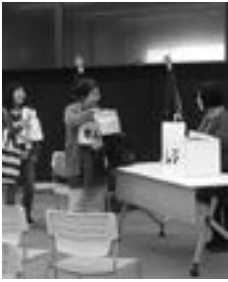
認知症への理解を深めるために支援