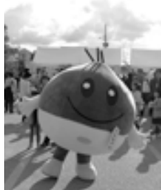
イベントでくりちゃん が市をPR