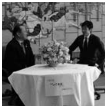
うますぎる栗東大使の皆さんと市の魅力を発信していきます