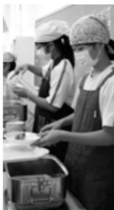
新しい学校給食共同調理場の稼働で安全・安心でおいしい給食を提供