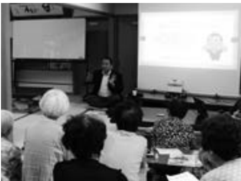
市長のこんにちにはトークや座談会で皆さんの声を聴き、ともにまちづくりを考えます

特に、重点として掲げている「五つの安心」、すなわち「経済に安心を」「教育・子育てに安心を」「福祉・健康に安心を」「暮らしに安心を」「行政に安心を」に基づき、本市の持つ「強みや特長」を生かしつつ「いつまでも住み続けたいくなる安心な元気都市栗東」の構築に向け、何事にも果敢に「挑戦」してまいります。