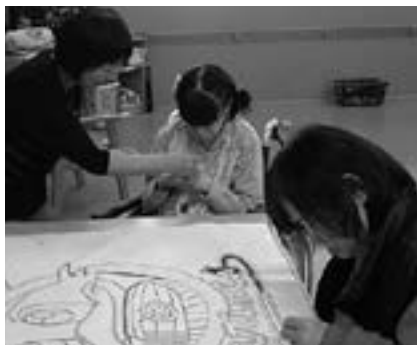
利用者やセンターの人たちとの交流により皆さんの笑顔が広がっています。