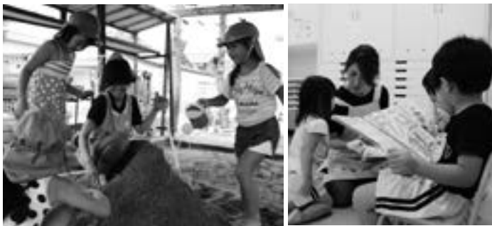
～昨年度の保育体験～ 「元気いっぱいの子どもたちとふれあえて楽しい」と参加者。

具体的な場所、日時、申込方法などの詳細は、後日、広報や市ホームページなどで案内します。随時、「臨時保育士」「臨時幼稚園教諭」の募集もしています。詳しくは市ホームページをご覧ください。