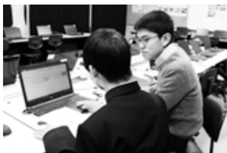
後輩とともに、栗東市版ごみ出し情報アプリを制作（14ページもご覧ください） ※アプリは http://ritto.5374.jp/ で閲覧可能

■ごみ出しアプリも制作されました プログラミングを趣味として楽しみながらも、自己満足ではなく、直接人の役に立つものも作りたいと思っていたときに、市民がーT（情報技術）を活用して地域課題を解決する「シビックテック」を紹介されました。金沢市に拠点を置く一般財団法人がごみ問題を解決するために開発し、プログラムを無償提供している「5374.jp」はその取組みの代表例としてよく知られています。そこで、その栗東市版を制作しました。無料で誰もが利用できるアプリで、いつでもどこでも、スマートフォンでごみの収集日や分別方法を確認することができます。