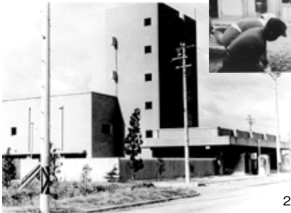
①大宝郵便局の公衆電話（奥の左側） 昭和34年（1959） ②完成直後の栗東電報電話局（現在のNTT西日本栗東別館） 昭和42年（1967）ごろ