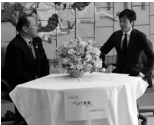
▲委嘱式で日本騎手クラブ会長武豊騎手との対談

「うますぎる栗東大使」(広報大使)は、本紙などで広報しているとおり、平成30(2018)年度から本市出身、または、ゆかりのある著名人などに依頼し、本市の魅力や話題などを発信し、全国