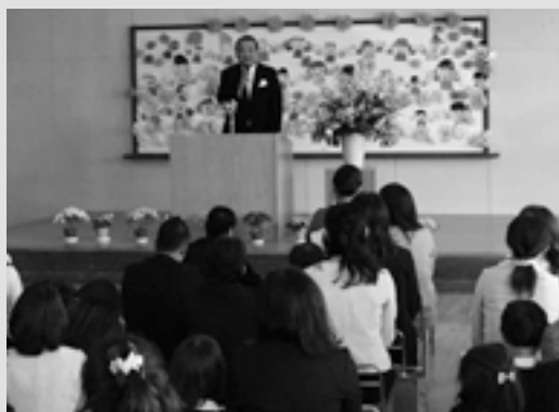
4月9日 治田保育園入園式