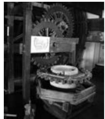
西みせには直径4メートルに及ぶ大きな車輪の木製動輪製薬機