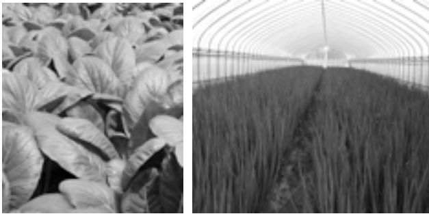
▲みずみずしいコマツナ ▲ネギの育成

今回のうますぎブランドは、浅柄野地区です。 本市の農業は水田での水稻栽培が大部分を占めていますが、浅柄野地区はそのほとんどが畑地であり、ビニールハウスによる野菜栽培が盛んに行