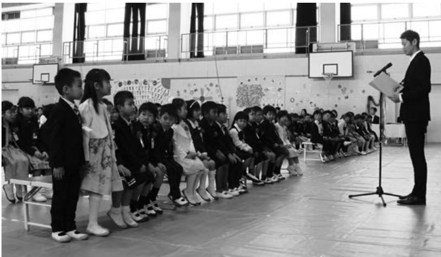
(入学式/ 4月8日・大宝西小学校)