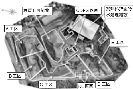
平成30年度の工事施工箇所

工事や周辺地下水などの状況、現地見学会の詳細は、県ホームページ ( http://www.pref.shiga.lg.jp/ippan/kankyoshizen/haikibutsu/ ) をご覧ください。