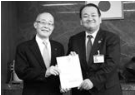
福原快俊教育長（左）と野村市長

就任にあたっては「子どもたちのため、市民のために本市の教育の充実・発展に向けて市長とともに取り組んでいきます」と抱負を述べられています。