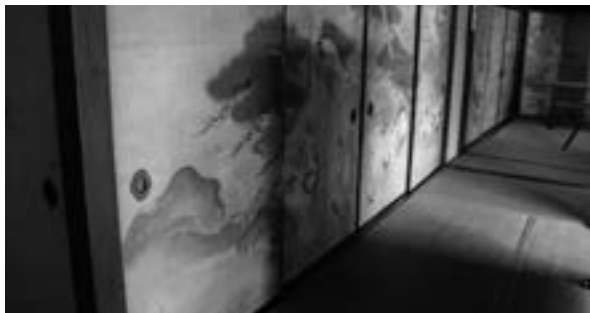
東海道のカーブに沿って建物が建てられており、それに伴い、畳も規格外の仕様になっている