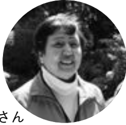
栗東市 ボランティア 観光ガイド