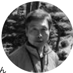
栗東市 ボランティア 観光ガイド