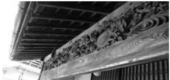
大名を出迎えた本陣玄関の欄間は表が鶴亀、裏は松竹梅の豪華な装飾が施されている