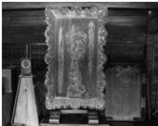
当時の外看板は、現在中みせに飾られている 店名「ぜさい」、薬名「わちうさん」