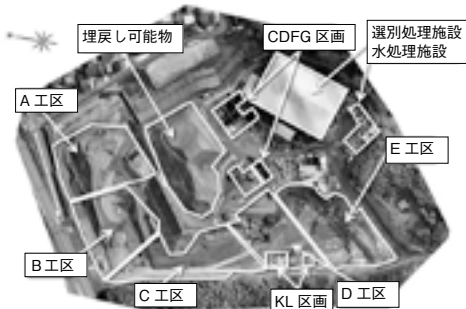
平成30年度の工事施工箇所

工事や周辺地下水などの状況、現地見学会の詳細は、県ホームページ ( http://www.pref.shiga.lg.jp/ippan/kankyoshizen/haikibutsu/ ) をご覧ください。